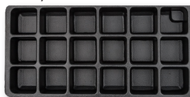
Pusty wkład 18 komór - 73