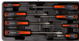
Wkrętaki - 67