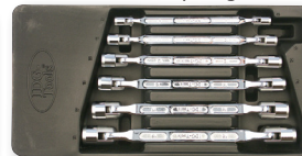
Klucze nas-przeg - 7