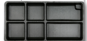
Pusty wkład 6 komór - 70