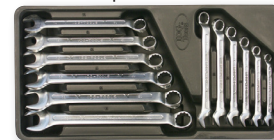
Klucze pł-oczkowe - 6