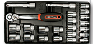
Nasadki 1/2" - 19